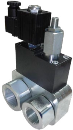
Con limitadora With relief valve